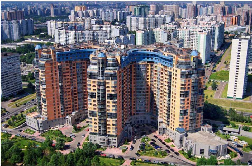
Рис. 4. Жилой комплекс «Корона» на проспекте Вернадского в Москве.

и по причине смены поколений и состава их жителей. Обеспеченные и трудоспособные переселяются в более комфортные дома и районы. Их квартиры часто сдаются внаем нелегальным эмигрантам, временным рабочим. Остающееся население, как правило, не готово вкладывать силы и средства в содержание общего имущества домов и территорий. Кроме того разрушаются соседские связи, сложившиеся в тот период, когда люди заселялись в ведомственные дома, были связаны совместной работой и знакомились через своих детей, посещавших одни школы и садики, игравших на одной площадке во дворе.