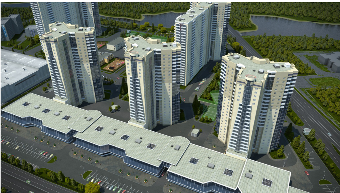
Рис.3. Микрорайон бизнес-класса «Западный луч» по ул. Труда в г. Челябинске.

Исследования подтверждают, что детские площадки закрытого типа малопривлекательны в отличие от спонтанных мест совместных игр детей, где находятся люди разных возрастов [2]. Как отмечает редактор журнала «Проект Балтия», «Конфликт современного двора в том, что различные силы стремятся к тотальному функциональному контролю над ним, не допуская возможности совместного использования. В какой-то степени это следствие модернистского культа зонирования, но в гораздо большей мере это объясняется жесткостью неолиберализма» [3].