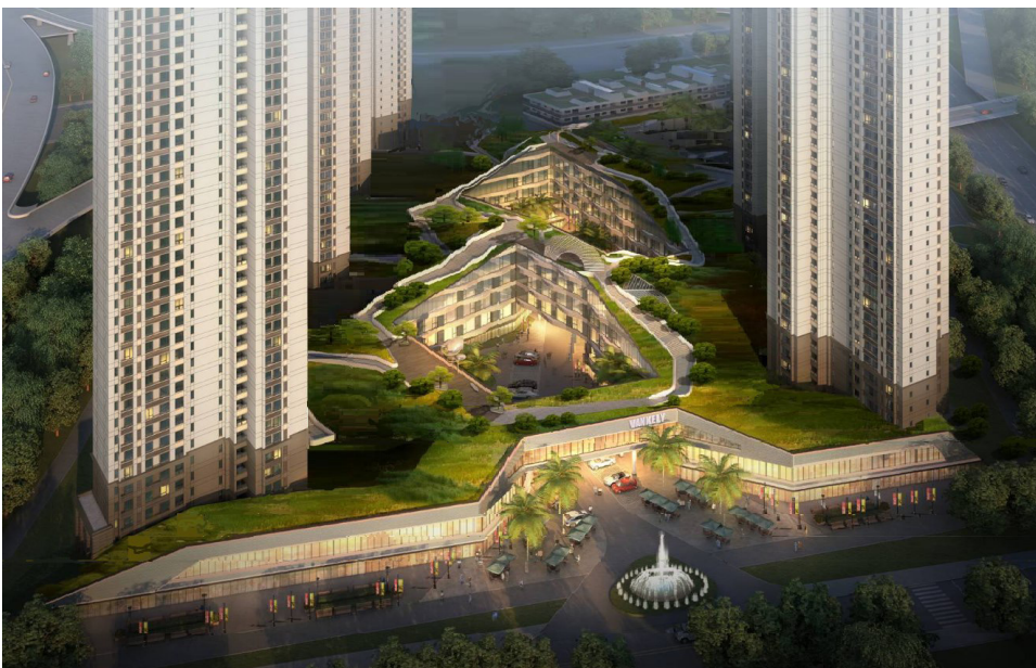
Рис. 5. Проект голландского архитектурного бюро NL Architects по преобразованию района типовых 30-этажных домов в г. Сямынь, провинция Фуцзянь, Китай. Источник: http://www.nlarchitects.nl/slideshow/286/

Для взрослого населения и пенсионеров современное состояние придомовых территорий не оставляет места. В то же время отдельные инициативные попытки благоустроить территорию встречают отторжение. Известный пример с проектом двора в Юго-Западном районе Москвы (довольно благополучное место) выявил неспособность к взаимодействию соседей как из-за большого количества квартир, так и за счет отсутствия горизонтальных связей [4]. При том, что затраты не коснулись бы самих жителей, главная причина их нежелания благоустроить двор выразилась в опасении привлечь в