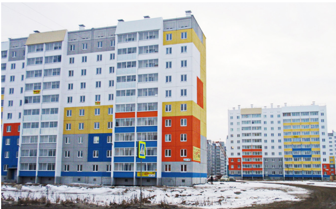
Рис. 1. Жилые дома нового микрорайона «Парковый» в Челябинске

пример, в Челябинске до 2017 года подлежат расселению 604 дома, за 2014 год были расселены только 9 из них. По программе, утвержденной 7 ноября 2013 года, переселения ждут более 11 тыс. человек [1].