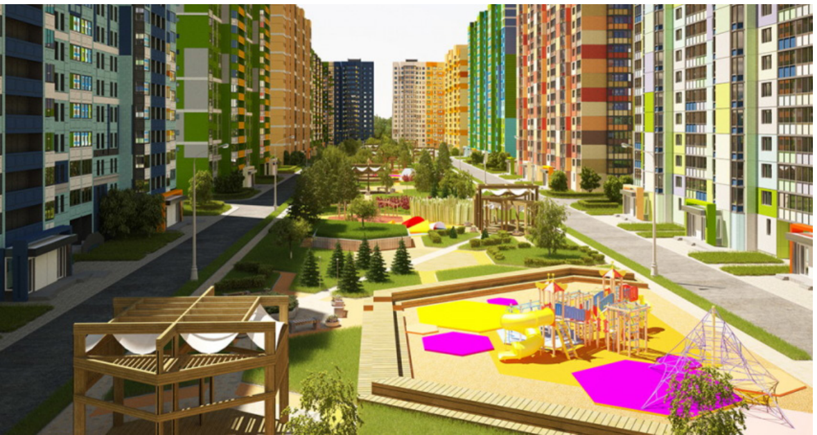
Рис. 6. Жилой комплекс на Базовской улице в Москве. Проектное бюро «Терра-Аури».

него асоциальных типов, шумные компании. Особую неприязнь вызывало устройство фонтана.